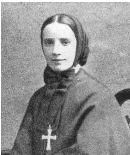
Santa Francisca Javier Cabrini

Nace: 15 de julio de 1850 en Sant'Angelo Lodigiano Fallece: 22 de diciembre de 1917 en Chicago (Estados Unidos)) Beatificación: 13 de noviembre de 1938 por el Papa PíoXI Canonización: 7 de julio de 1946 por el Papa Pío XII. Patrona de los emigrantes En 1880 funda el Instituto de las Misioneras del Sagrado Corazón de Jesús. En Madrid funda: 1899: Colegio León XIII 1907: Colegio Sta.Fca.Javier Cabrini